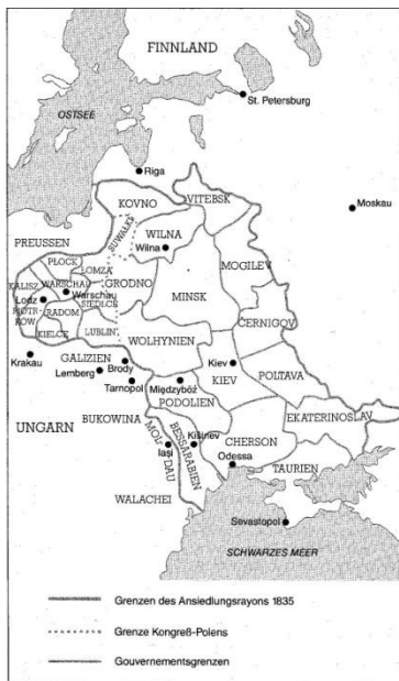
Ansiedlungsraum nach Haumann S.79

Im folgenden Text geht es darum, einen Menschen zu verstehen. Dabei ist meiner Meinung nach eine individuelle Analyse seiner Biografie, aber auch eine kulturelle nötig. Mit dieser kulturellen Einbettung von Yalom will ich beginnen. Sie ufert zuerst ein bisschen aus. Ich hoffe aber, ich kann Sie, liebe Leserin und lieber Leser für den geheimnisvollen Kulturraum Mittel-Osteuropas um 1900 begeistern.